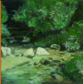
Bach im Sommer